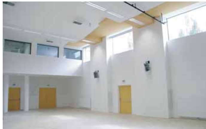
Schon vom Eingangsbereich im Erdgeschoss öffnet sich der Blick in den Saal zur Bühne durch Schallschutzverglasungen. Die natürliche Belichtung über eine Fensterband auf der Südseite in den Saal, in das Untergeschoss verlängerte Glasfassaden im Stiegenhaus und Glasoberlichten in das Publikumsfoyer lassen den gesamten Bereich hell und sonnendurchflutet wirken.

Böden mussten einen erhöhten Trittschallschutz nach unten und zu den benachbarten Räumen erfüllen.