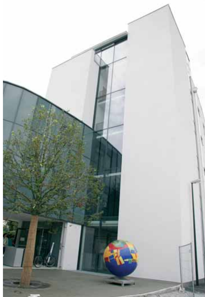
Zurückhaltung in der Außengestaltung mit einer hellen Putzfassade als Kontrapunkt zum dunklen Fernheizwerk und einer hellen Glasfassade für den Verwaltungstrakt lassen das Musikum als logischen Abschluss der Kaiverbauung erscheinen.

Ein Bauplatz in der Altstadt-Schutzzone zwischen einer Gründerzeitvilla, der Bahn und dem umstrittenen Fernheizwerk direkt an der Salzach am Ende der klassischen Villenverbauung, ein enger Kostenrahmen, hohe technischen Anforderungen an ein Haus für Musik, ein exaktes Raumprogramm sowie das bereits genehmigte Büro- und Wohnhaus von Wenzl Hartl als Rahmenvorgabe waren die schwierigen Voraussetzungen für die Planung. Seit 19. September 2006 ist das Haus der Musik eröffnet.