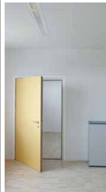
Für die meisten anderen Musikräume wurde eine Nachhallzeit von 0,7 s gefordert. Nach den Vorgaben des Akustikers wurden die Gipskarton-Kassettendecken mit glatten und gelochten Platten gestaltet.

Der Veranstaltungssaal wurde mit einer Akustikdecke ausgestattet, die sowohl allen formalen wie physikalischen Ansprüchen gerecht wird. Die beidseitige absorbierende GK-Lochdecke wurde in Kassettenebauweise ausgeführt, um einen leichteren Zugang zu den Installationen zu gewährleisten. Die gute Zusammenarbeit von Architekt, Bauphysik und den Hartl Bau Innenausbauern