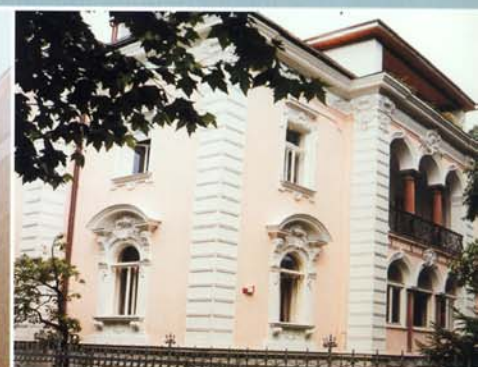
ALTHAUSSANIERUNG VILLA IN SALZBURG