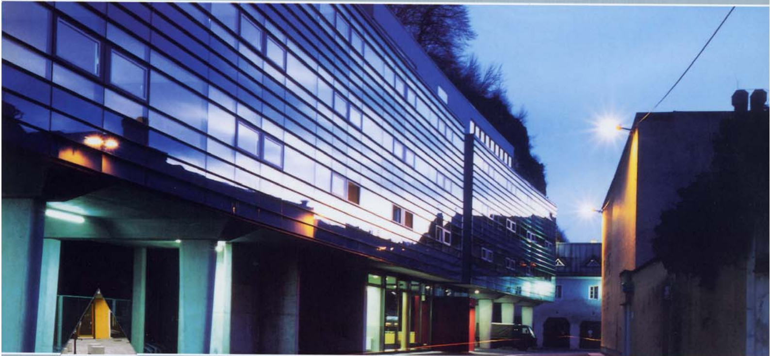
SANIERUNG HAUS JAKOLITSCH