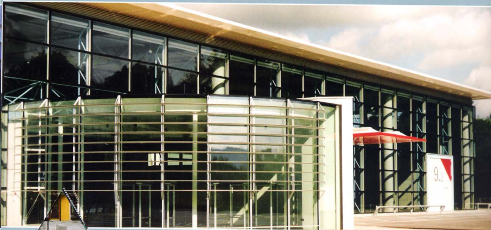
RENOVATION HAUS JAKOLITSCH