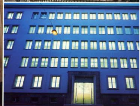
ALTHAUSSANIERUNG BÜROHAUS SCHWARZSTRASSE

GENERALUNTERNEHMER SCHLÜSSELFERTIGE ERSTELLUNG VON INDUSTRIEANLAGEN BAUMEISTERARBEITEN ALLER ART FERTIGTEILBAU INNENAUSBAU, WAND, DECKE, TÜREN, DECOR SCHALL- UND WÄRMEISOLIERUNG ALTHAUSSANIERUNG, GROSSGARAGENANLAGEN HARTL SCHALLSCHUTZDAMM ALS BEGRÜNTER STEILDAMM BAUABDICHTUNG NACH SYSTEM RENESCO ÖKOLOGISCHE BAUBERATUNG